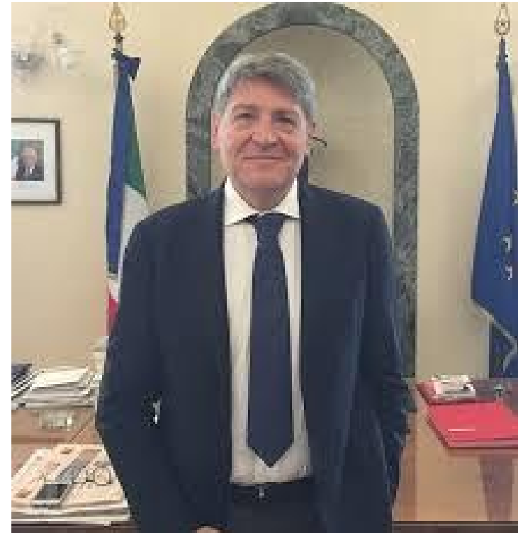
Brindisi, 29 Maggio 2017 Prefetto di Brindisi, Valerio Valenti

[...] « L'immigrazione è una questione nazionale, avvertita qui e per questo intendo dialogare con le istituzioni locali perché sono convinto che l'accoglienza si può avere e si deve avere. E' possibile avviare percorsi virtuosi per l'integrazione, avviando protocolli d'intesa con i Comuni, partendo dal presupposto che i migranti non sono un peso, ma possono essere destinati ai lavori socialmente utili »